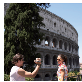
IMAGE001.JPG デジカメが自動生成したファイル名は探しにくい